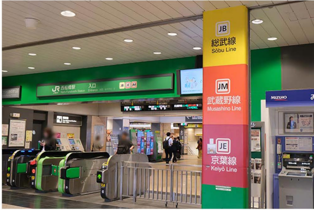
① 西船橋駅の改札を出ます