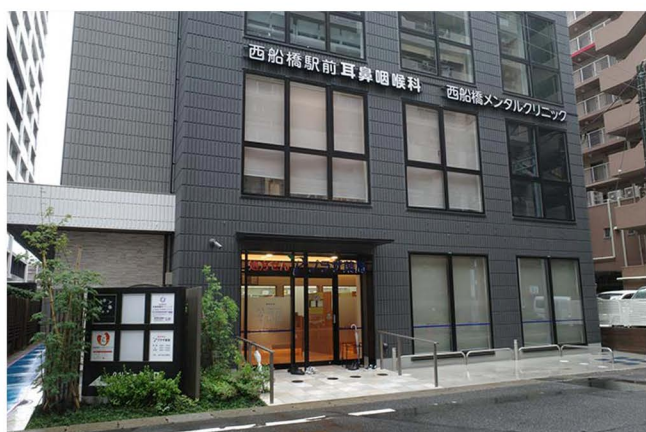
9 左手に見えるビルの2階が当院です