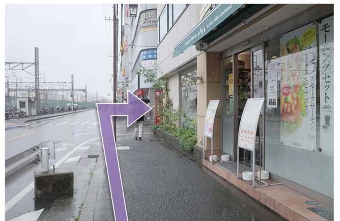
⑥ ドトールコーヒーの先の交差点を右折します