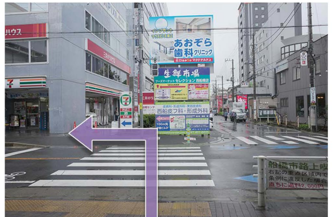
④ 階段を降りたら横断歩道を渡り、左に進みます