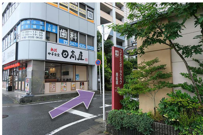
7 ドトールコーヒーと日高屋の間の路地を進みます