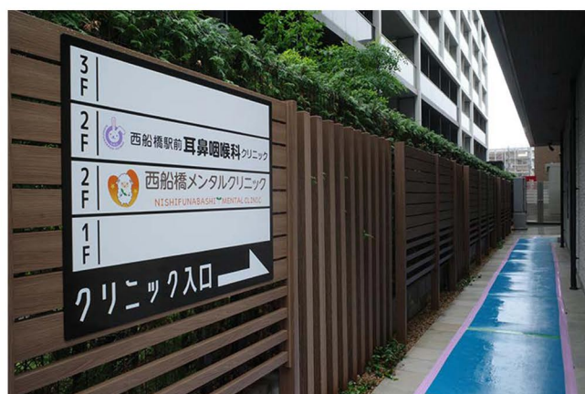
10 ビル左側の通路を進みます