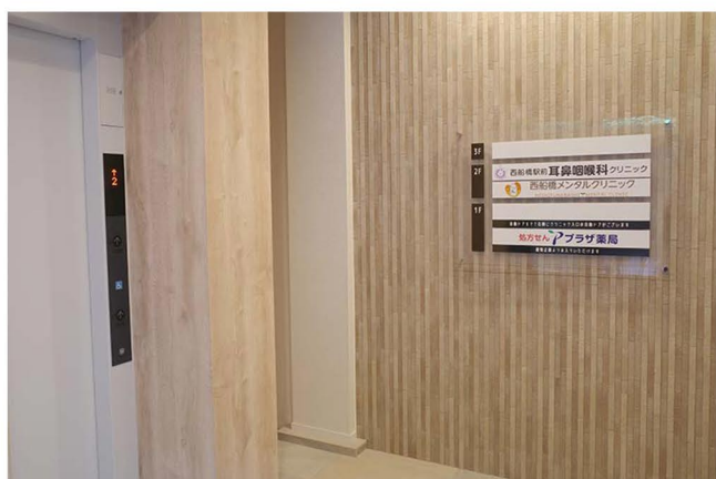
11 エレベーターで2階にお上がりください